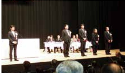
県暴追センター会長 県警察本部長 連名表彰受賞者