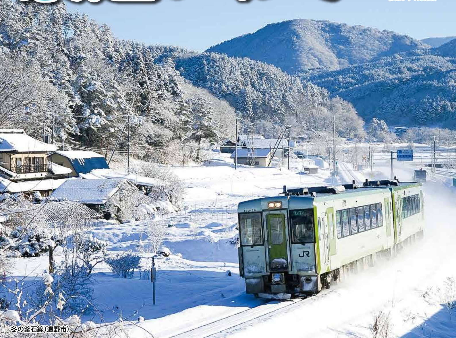
冬の釜石線(遠野市)