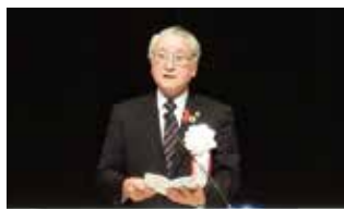
暴力追放釜石地区会議会長 野田武則 釜石市長