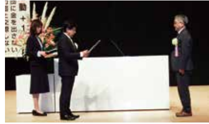
感謝状の贈呈 代表 医療法人仁医会財団釜石厚生病院