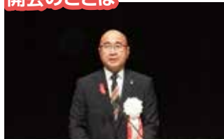
平野公三 大槌町長